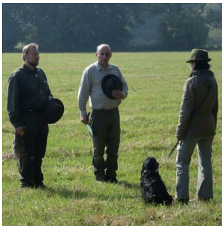
Rozhodčí hodnotí výkon psa po vykonání disciplíny. Při hodnocení výkonu našeho psa předstoupíme před rozhodčí a pozorně posloucháme, abychom se poučili ze svých chyb. Pánové (to se týká vůdců i rozhodčích) při této příležitosti smekají, dámy ne. možná dle místa

Je přirozené, že podle nůry vůdce ke zkouškám patří i tréma. Je to přirozené, ale je nutné se ovládat, neboť nervozita vůdce může působit i na psa. V každém případě se vůdce musí chovat ukázněně a tiše! Dejte si svačinu, zapalte si cigaretu, zbytečně nehlučte, zvláště pak na disciplínách, jako je odložení, dohledávka, vlečka atd., prostě tam, kde je zapotřebí klid a soustře-