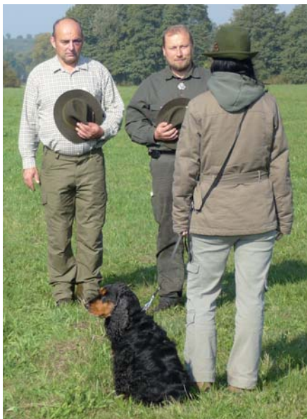
Vůdkyně podává rozhodčím hlášení před započatím první disciplíny. Všimněte si klobouku – pánové (rozhodčí) smekají, dáma klobouk nesmeká.