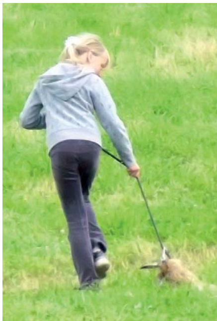
Tahání vlečky – do výcviku můžeme zapojit celou rodinu.

dlouhém 1-2 metry. Na konci vlečky zkontroluje neporušenost zvěře, sejme z ní provázek a položí ji na konec stopy kolmo ke stopě. Sám ve směru vlečky poodejde cca o 50 kroků dál a ukryje se. Pokud cvičíme sami, nezbyvá nám, než se po ukončení stopy vrátit na začátek (vždy se vracíme v dostatečné vzdálenosti od založené stopy, aby pes nesledoval naši stopu místo stopy zvěře), a teprve poté přivést psa. Zakládání vlečky by pes totiž nikdy neměl vidět.