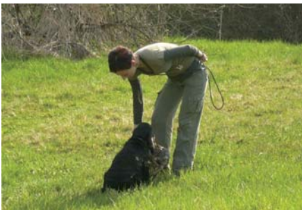
Kokršpaněl po návratu z vlečky předává zajíce.

Slídění by mělo probíhat zásadně proti větru, popřípadě s mírným bočním větrem. Jako vhodný terén můžeme zvolit pole s porostem, ve kterém je zvěř kryta, aby ji pes nemohl příliš daleko hledat zrakem. Je možné využít i strniště s řádky slámy. V začátcích je lepší porost takového vzrůstu, aby psa příliš neomezoval v pohybu po stopách a za zvěř, u velmi pokročilého výcviku je možné vybírat vyšší porost, kde je pes nucen používat svůj nos a plně se na něj spoléhat.