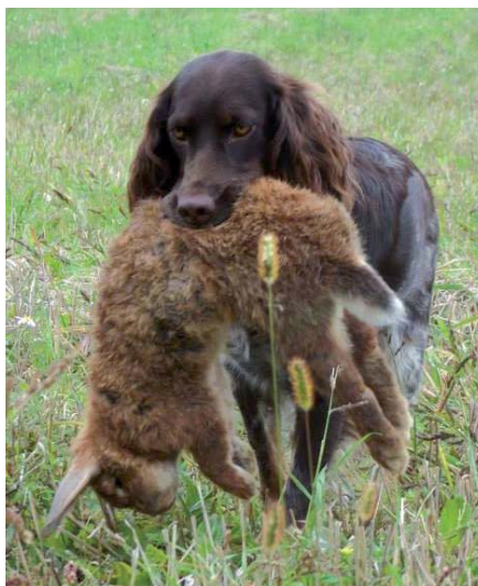
Přinášení srstnaté zvěře

Dohledávka a přinášení učíme zpravidla tak, že pohodíme zvěř do prostoru, aby ji pes neviděl, a s povelu „hledej – aport!“ ho vypustíme. Vypouštíme ho zásadně proti větru, aby mohl zvěř spolehlivě navětrít. Samozřejmě předpokládáme, že pes má v tuto chvíli již perfektně zvládnutý aport. V tom případě pes zvěř zpravidla navětrí, přijde k ní, ihned ji uchopí a přinese. Pro takového psa nešetříme pochvalou ani odměnou. Může se však stát, že pes nalezenou