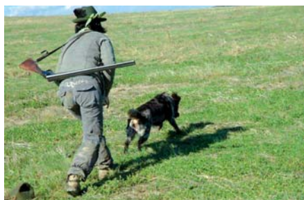
Vypouštění psa na vlečku

Honitba je pozemek, na kterém je povoleno vykonávat právo myslivosti. Jedna honitba může obsahovat více pozemků různých vlastníků. Pozemky, na kterých není myslivost povolena, se nazývají nehonební. Rozhodně nespolečáme na to, že zrovna nás si nikdo nevšimne, a tak necvičíme v cizí honitbě bez souhlasu mysliveckého sdružení či honebního společenstva, které v ní vykonává právo myslivosti a jako jediný oprávněný subjekt o zvěř v ní pečuje! Věřte tomu, že psovoda s cvičícím psem si myslivci velice rychle všimnou, aniž by o tom psovod měl jakékoli tušení. Naopak přítomnost dobrého myslivce v lese kolikrát ani nezaregistrujete, takže vů-