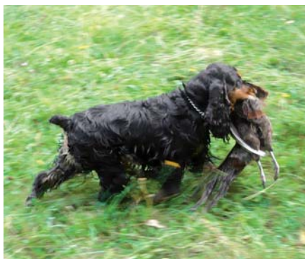
Kokršpaněl našel bažanta a uhání s ním k vůdci.